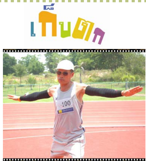
▶ ทำพิธีจมน้ำ...วงแขนชาวสะอาด เรียบเนียนภายใน 7 วัน!!..