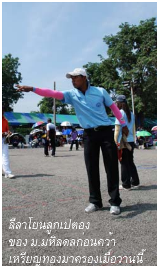
ลีลาโยนลูกเปตองของ ม.มหิดลก่อนคว้าเหรียญทองมาครองเมื่อวานนี้

สำหรับกีฬาน่าสนใจวันนี้ (7 พ.ค. 52) ยังมีให้ลุ้นชม และเชียร์อีกหลายชนิดกีฬา โดยโปรแกรมการแข่งขันที่ น่าสนใจมีดังนี้ กรีฑา ชิง วันสุดท้าย 21 เหรียญทอง เริ่มแข่งขันเวลา 07.00 น. และ 16.00 น. โบว์ลิ่ง ชิงเหรียญทองสุดท้าย ประเภททีมทั่วไป 3 คน คู่สตรีค - คีสแปรร์ กอล์ฟ รอบชิงชนะเลิศ ฟุตบอล รอบรองชนะเลิศ ม.นครพนม พบกับ ม.เกษตรศาสตร์ และ ม.ขอนแก่น พบกับ ม.ธรรมศาสตร์ แข่งเวลา 16.30 น. วอลเลย์บอล รอบ